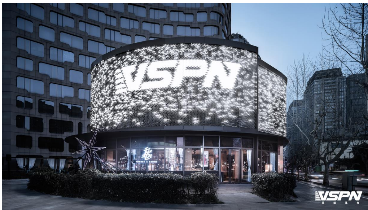
圖：上海新天地量子光-全球電競會客廳

電子競技行業是近年來國家政策鼓勵支持的重點方向之一，國泰君安國際對VSPN的支持不僅積極回應、參與政府推進電競體育產業結構升級、以電競賽事帶動文化娛樂行業及經濟發展的政策，更有機會為現有 財富管理客戶 提供優質的產品選擇，促進集團各業務間的高效融合與協同發展，並與客戶攜手共贏。